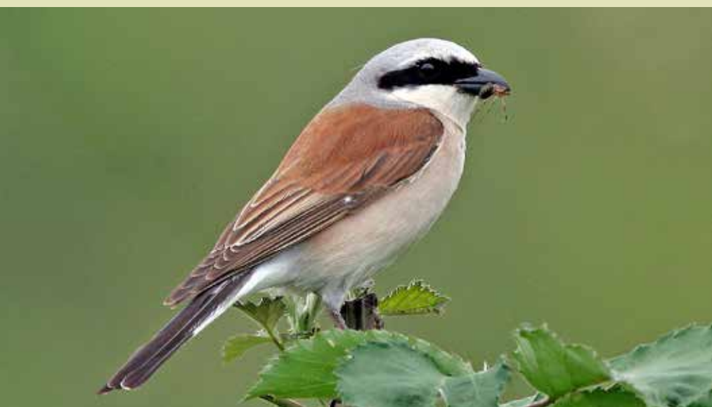
La pie-grièche écorcheur fait son nid dans des haies et des buissons épineux de faible hauteur. Depuis des perchoirs, elle chasse divers insectes et petits mammifères.